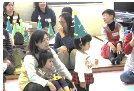
第3回子育てサロンの様子

今回で3回目となる子育てサロンには、外は吹雪の中にもかかわらず、7組12名の親子が参加して下さいました。12月班が中心となって準備をしてきたスタッフお手製のサンタクロースのそりに乗りながら、歌を歌ってクリスマス気分を楽しみました。また、色とりどりのツリー型帽子も完成し、満足げな子ども達の顔を見て、会場の皆が笑顔となる時間を一緒に過ごすことができました。