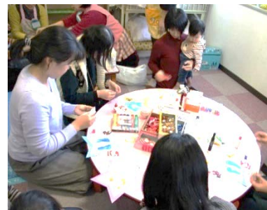
第3回子育てサロンの様子