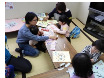
第2回子育てサロンの様子