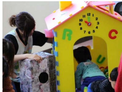
第2回子育てサロンの様子